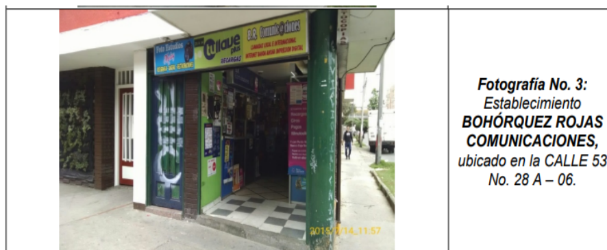
Fotografía tomada el día 14 de julio de 2015