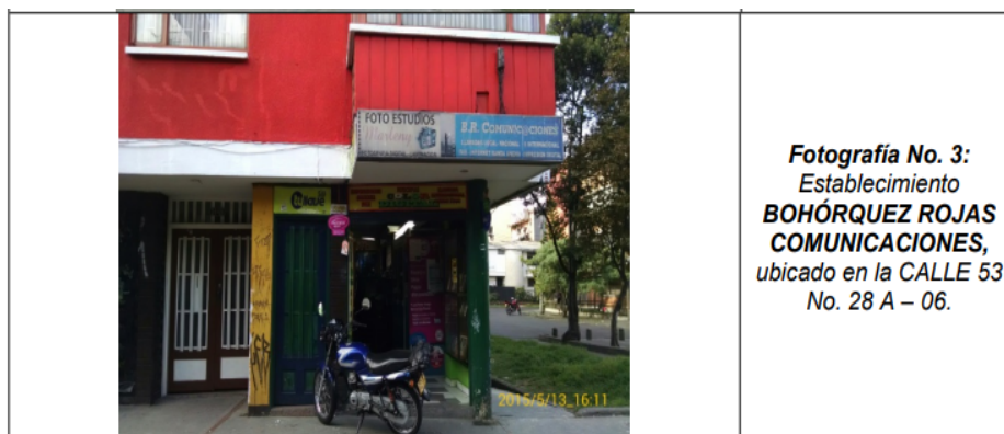
Fotografía tomada el día 13 de mayo de 2015

Que, con el ánimo de atender los argumentos presentados dentro del escrito de reposición de la referencia, es pertinente afirmar que la infracción ambiental existió como lo indica lo establecido en el Concepto Técnico 10814 del 29 de octubre del 2015 el cual es la prueba fundamental dentro el presente procedimiento sancionatorio, dado que en el mismo se logra evidenciar fotografías captadas el día 13 de mayo de 2015 fecha de la primera visita de control y seguimiento por parte de esta Entidad y del 14 de julio de 2015 fecha de la segunda visita de control y seguimiento, donde se demuestra que efectivamente los avisos se encontraban adosados a la fachada del establecimiento comercial denominado BOHORQUEZ ROJAS COMUNICACIONES registrado con matrícula mercantil 1292072, ubicado en la Avenida Calle 53 No.28 A-06 de la localidad de Teusaquillo de esta Ciudad, y que los mismos en ninguna de las dos visitas contaban con el respectivo registro ante la Secretaria Distrital de Ambiente.